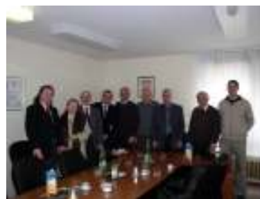
Godišnja skupština inovatora, veljača 2007.

Članovi Društva imali su zapaženi nastup, te za svoje inovacije dobili jednu zlatnu, dvije brončane medalje i posebno priznanje HSI za promicanje ideje inovatorstva u svojoj sredini.