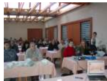
Teambuilding mentora Plato Hrvatska Vodice, veljača 2007.